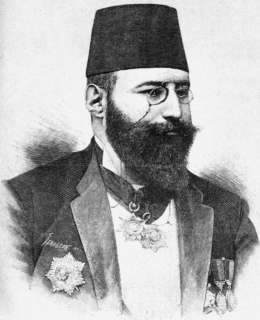
ΑΝΤΩΝΙΟΣ ΚΩΜΑΝΟΣ ΠΑΣΑΣ