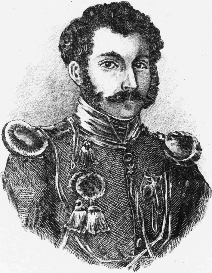
ΒΑΡΩΝΟΣ ΡΙΧΑΡΔΟΣ ΦΟΝ ΒΙΣΣΕΛ