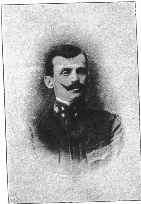
□ ΙΩΑΝΝΗΣ ΛΕΩΝ. ΔΕΛΗΓΙΑΝΝΗΣ □ Ἐπολοχαγὸς τοῦ Πυροβολικοῦ

ἘΝ τῷ Ἠρώφ τῶν ὑπὲρ πίστεως καὶ πατρίδος πεσόντων μίαν ἐκ τῶν διαπρεπεστέρων θέσεων κατέλαβε καὶ τὸ ὄνομα τοῦ Ἐπολοχαγοῦ τοῦ Πυροβολικοῦ Ἰωάννου Α. Δεληγιάννη , φονευθέντος ἐν τοῖς λόφοις τοῦ Θωρακησίου τῆς Ἡπείρου τὴν 16ην Ἰανουαρίου 1913.