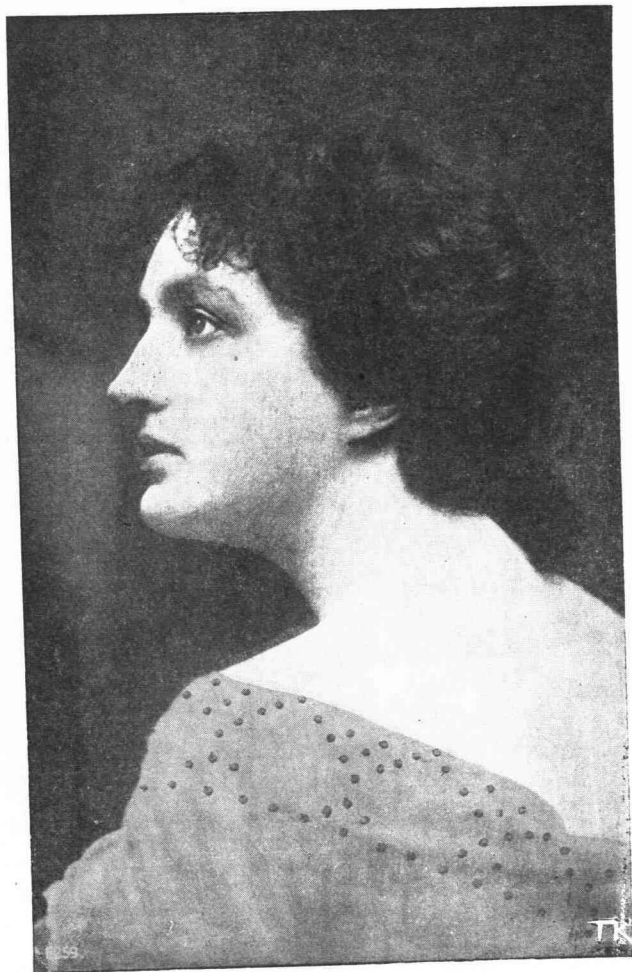
✱ ΜΑΤΑΚΙΑ ΠΛΑΝΑ! ✱

✱ Δὲν εἶσατε οὖς τὰ δίδυμα τοῦ Οὐράνιου Κύνου ἀστέριμα Ποῦ πᾶν καὶ καθρεφτίζονται ἀεὶ ἀτάσθα νερά, Σ'ε μιά νυχτὶ ἀξεδιάντη εἶσατε διὸ μαχαίρια Ποῦ ἀσπάζετον καὶ ξεοσάζουνε καὶ δεῖχονταὶ σκληρά.