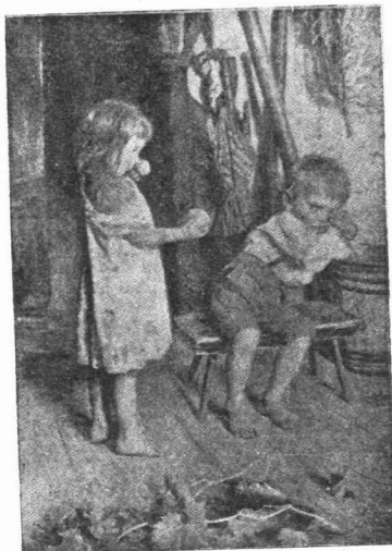
* ΕΞΙΛΕΩΣΙΣ *

Καίτοι δίδονται πολλοὶ ἀφορμαὶ καθιστῶσαι ἀναγκαῖον τὸ κήρυγμα τῆς ὁμονοίας πρὸς αὐτοὺς, ἐν τούτοις κατὰ τὴν ἐν ταῖς Ἠνωμέναις Πολι-