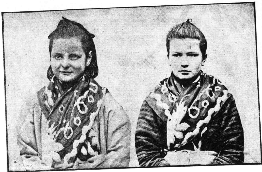
—•— Τάσεις ανθρωποκτονικά —•—