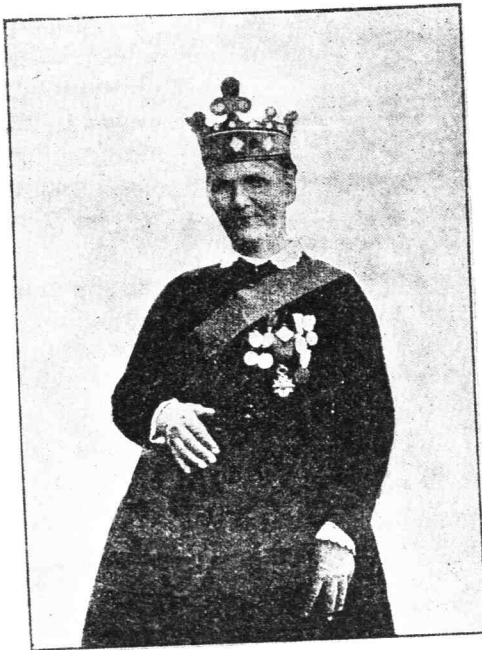
✱ Μία πάσχουσα ἐκ μεγαλομανίας, ἣτις νομίζουσα ἐαυτὴν Ἀυτοκράτειραν, φέρει στέμμα καὶ παρόσημα διάφορα ἰδίας αὐτῆς κατασκευῆς ✱

Τὰ αἷτια δ' ἐν γένει εἶναι πλεῖστα, περὶ τοῦ τρόπου τῆς ἐπενεργείας ἐκάστου τῶν ὁποίων ὑπάρχουσι διάφοροι γνῶμαι. Ἀναμφισβήτητον μόνον εἶναι ὅτι ἡ προδιάθεσις ἔνεκεν κληρονομικότητος ἢ ἐπικτήτου προδιαθέσεως εἶναι ἐκ τῶν σπουδαιότερων αἰτιῶν. Κατὰ τὰς ἐρεῦνας ἡμῶν ἐπὶ 2.000 φρε-