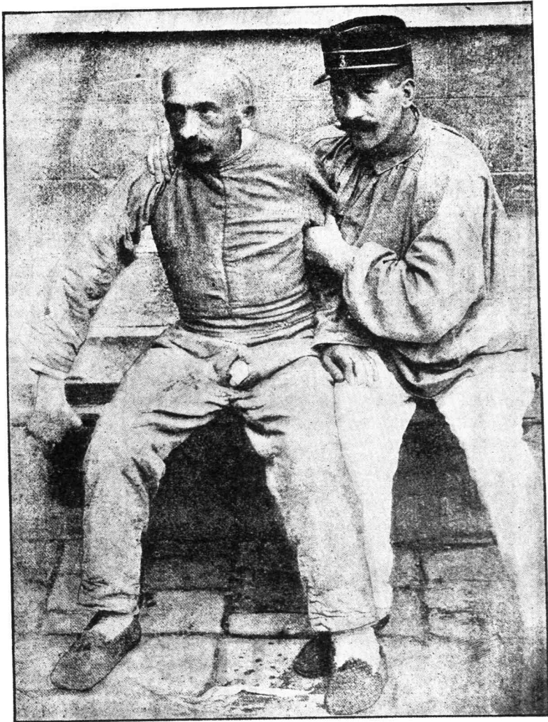
✱ ΥΠΟΞΥ ΑΛΚΟΟΛΙΚΟΝ ΠΑΡΑΛΗΡΗΜΑ ✱

κληρονομικῆς συφίλιδος, εἰς δὲ τὰς λοιπὰς περὶ παιδίων ἐκφύλων μετὰ διαφορῶν ἰδεοληψιῶν καὶ ἐγκληματικῶν τάσεων ἐκ γονέων ἀνισορρόπων, νευροπαθῶν ἢ ἀλκοολικῶν.