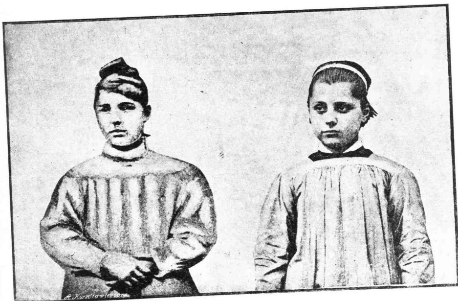
—⊗— Ἀνθρωποκτόνος —⊗—