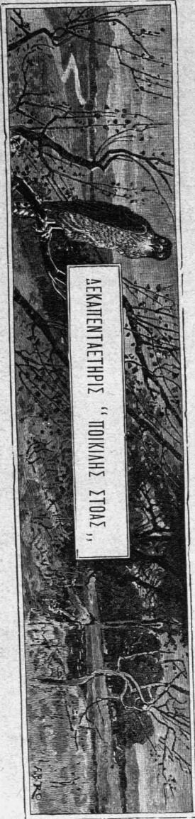
ΔΕΚΑΠΕΝΤΑΕΤΗΡΗΣ "ΠΟΙΚΙΛΗΣ ΣΤΟΑΣ"

Ἄλλ' εἶναι μόνοι τώρα· τὸ ὄνειρον ἐξήφρανε τοὺς πρὶν ὀχληροὺς συνορταστάς, χάριν τῶν ὁποίων ἐδανείζοντο τὰς λέξεις των ἀπὸ τὸ λεξικὸν τῆς κοινοτοπίας καὶ τῆς πεζότητος.