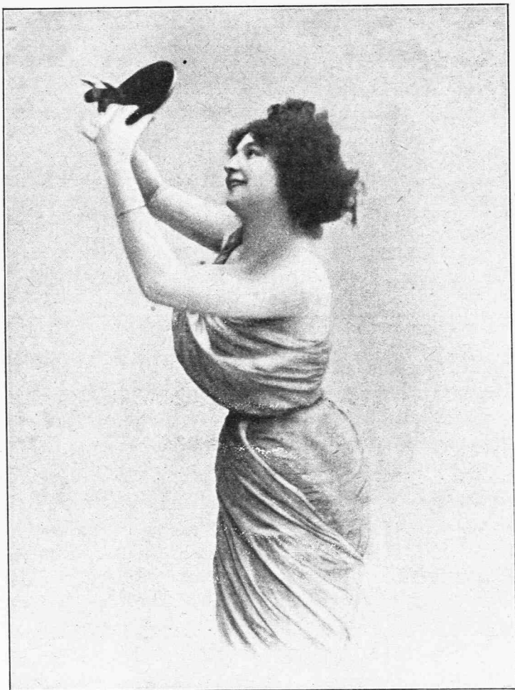
✱ ΑΠΟ ΤΑ ΞΗΜΕΡΩΜΑΤΑ ΤΗΣ ΖΩΗΣ ✱

Καὶ πρώτης τάξεως φάρσα τὸ ἐκ παλλεύκων πτερύγων καὶ ἀέρος ὄν διὰ τὸ ὁποῖον ἀνελύσσο χθές.