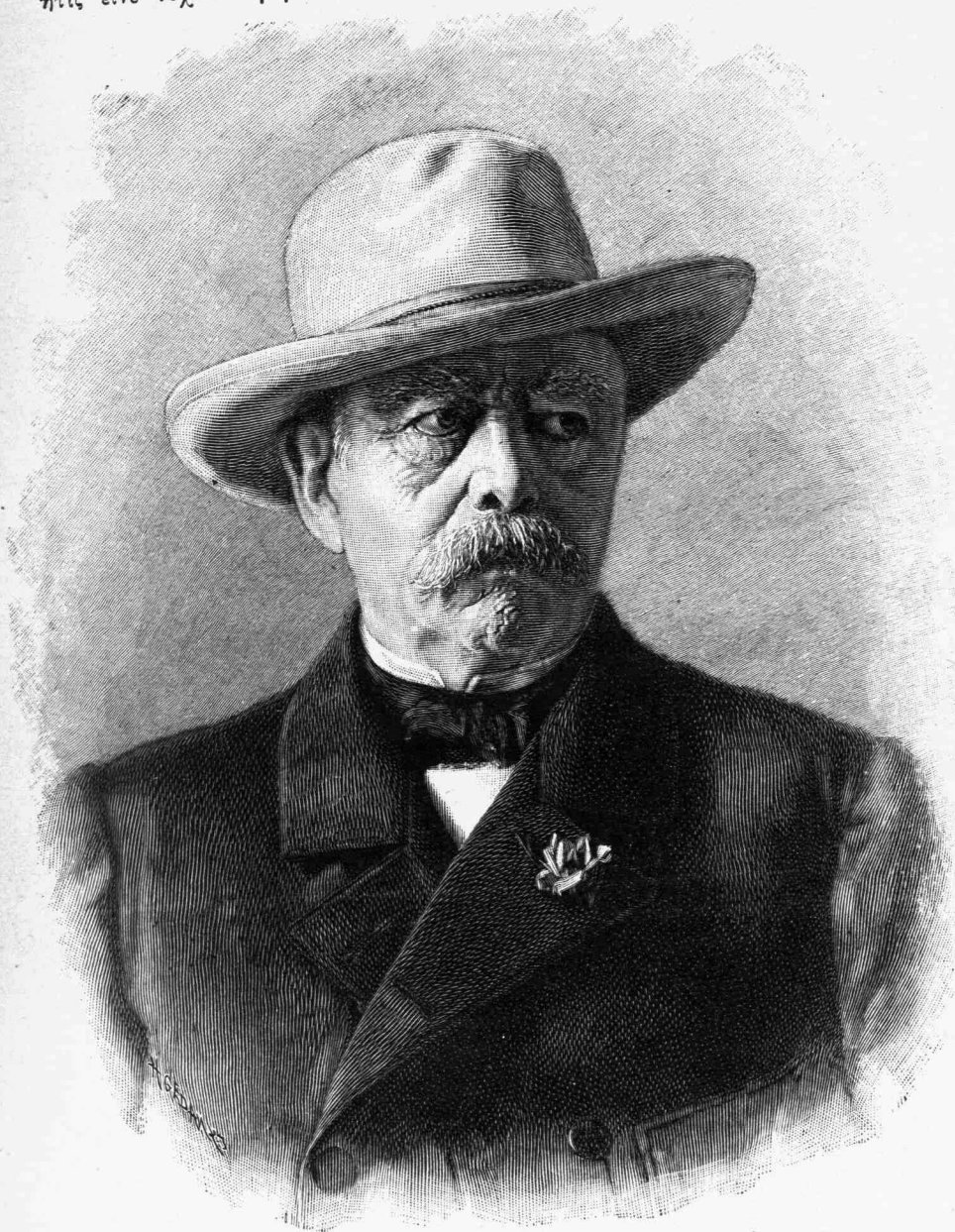
✱ ΒΙΣΜΑΡΚ ✱

ἥτις εἶνε τυχαῖον γεγονός ἐν τῇ σειρά τῶν ἀνθρωπίνων πραγμάτων.