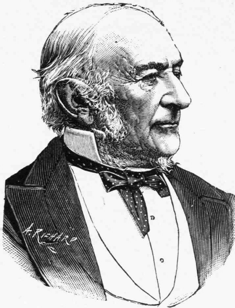
✠ ΓΛΑΔΣΤΩΝ ✠

Σπανίως ἄνδρες ἐνθουσιασταὶ ὅσον αὐτὸς καὶ ἐιλικρινεῖς δύ-