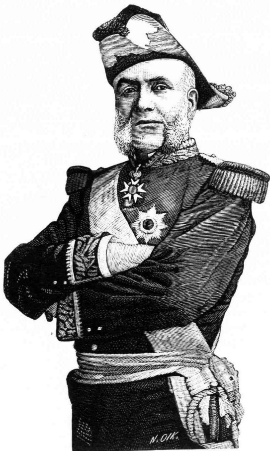
Ο ΝΑΥΑΡΧΟΣ ΔΕΖΕΝ (Λαυρέντιος Ίωσήφ) Ἄρχηγος τῆς Γαλλικῆς Ναυτικῆς Ἀποστολῆς.