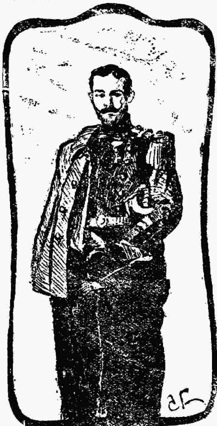
Ὁ συγγραφεὺς τοῦ «Ἀρραδῶνος τῆς Θαλάσσης».

Ποῦ καλὰ. Μὰ ὁ τίτλος αὐτὸς ταιριάζει σ' ἐφημερίδα; Νὰ ἐξηγουμένθα, πρὸς ἀκλῶ. Τί ἐννοεῖτε; ταιριάζει; Ἄν κτυπή καλὰ στ' αὐτὴ μήπως; Ἄν εἰν' ἔτσι, ταιριάζει καὶ πρὸς ταιριάζει. Εἶνε δισύλλαβος, τονίζεται ἐπὶ τῆς ἀρχῆς, ἔχει σίγμα στὸ τέλος. Οἱ ἐφημεριδοπῶλοι λοιπὸν ἡμποροῦν νὰ τὸν φωνάζουν εὐκόλα καὶ οἱ ἀναγνώστῃ νὰ τὸν συνηθίσουν ἀκόμην