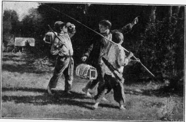
[Α. Κορζουζιν] Οἱ ἐχθροὶ τῶν πτηνῶν

Διότι εἶνε ἀδύνατον νὰ φαντασθῇ τις αἱ μακραὶ ἀποδημίαι τῶν πτηνῶν εἰς πόσας εἰκασίας καὶ θεωρίας ἔδωσαν γέννησιν τῇ συνδρομῇ καὶ τῆς φαντασίας, ἣτις εἶνε τὸ ἄλλας ὄλων τῶν ἐπιστημῶν,