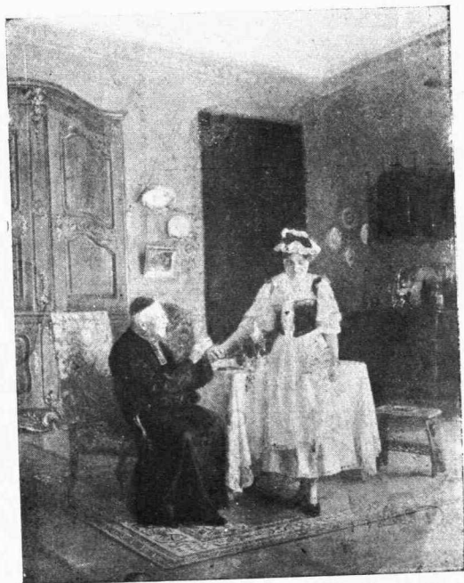
ΔΥΣΚΟΛΟΣ ΕΞΟΜΟΛΟΓΗΣΙΣ (Έργον τοῦ V. marais-Milton)