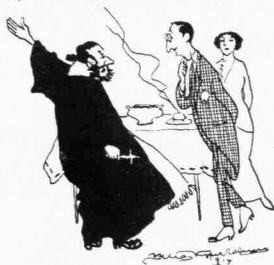
«... νὰ ἔλεγε στὰς Δυνάμεις».