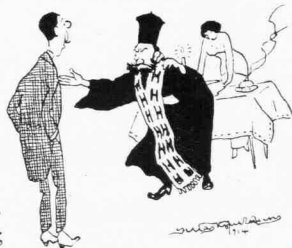
Κ' ἐφόρεσε τὸ πετραχήλι.

Καὶ ἐνθυμηθεὶς τὸν ἁγιασμόν εἶπε διακόπτων: «Βασιλεῦ οὐράνιε, παράκλητε, τὸ πνεῦμα τ'ῆς ἑθείας, ὁ παντάχου ῥῶν καὶ τ' πάντ' ῥῶν...»