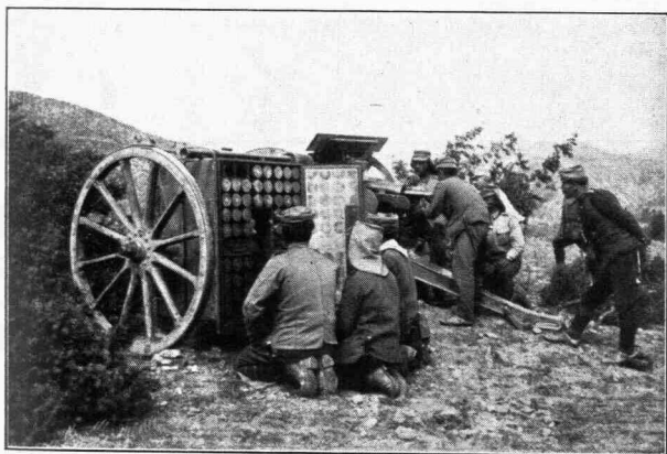
Ἑλληνοβουλγαρικὸς πόλεμος. — Στρώμνιτσα