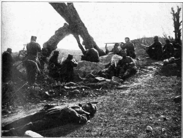
Μακεδονική ἐκστρατεία. — Μάχη εἰς τὸ Σόροβιτς