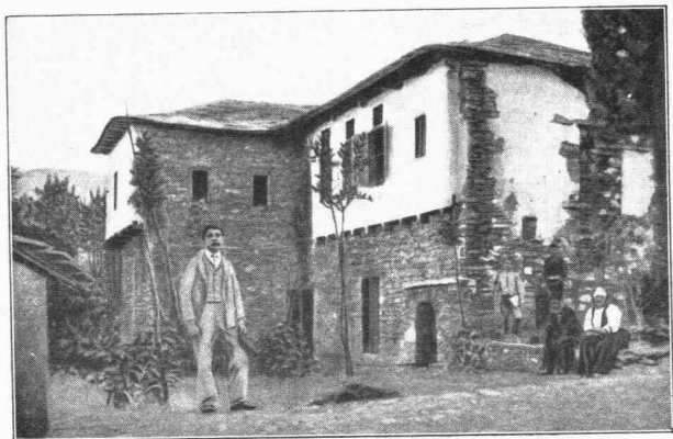
Τὸ ἐν Ζαγορᾷ Σχολεῖον ὅπου ἐσπούδασε τὸ πρῶτον ὁ Ρῆγας Φερραῖος