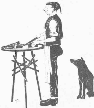
Ὁ χαλβατζῆς τοῦ Γαλατᾶ

Ἡ Κωνσταντινούπολις, ὡς θέαμα ἀπὸ τοῦ ἀτμοπλοίου, εἶνε ὄνειρωδῶς ὡραία. Γοητεία γραμμῶν καὶ χρωμάτων. Ἄλλὰ ἔχει τὴν ὑπόστασιν καὶ τὴν διάρκειαν ὀνείρου. Τὸ ἤγγισες; ἀπεβιβάσθης εἰς τὸ Καράκιοϊ; Ἡ ὄπτασία διελύθη. Θὰ ἀφυπνισθῆς εἰς τὴν πλέον οἰκτρὰν πραγματικότητα. Τρίβεις τὰ μάτια σου ἐκπληκτος. Ἀμφιβάλλεις ἂν εὐρέθης ἔξαφνα εἰς πόλιν ἢ μέσα εἰς φρενοκομεῖον. Σοῦ ἔρχεται αὐτομάτως ἡ σκέψις νὰ φύγῃς μὲ τὸ ἴδιο βαπόρι. Ἄλλ' ἀφοῦ ἀπετόλμησες τὸν ἠρωϊσμόν τῆς ἀποβιβάσεως, θὰ εἶνε κρῖμα βέβαια νὰ μὴ ἐπισκεφθῆς τὴν Σταμπούλ, τὸ ἀρχαῖον Βυζάντιον, τὴν Ἁγίαν Σοφίαν, τὸ Φανάρι, τὰς ὡραίας ἐκπλήξεις τῶν Πριγκηπονήσων, τὸ θαῦμα τοῦ Βοσπόρου, τῆς ἐμπορφιῆς καὶ τὰ θέλγητρα τῆς ἀσιατικῆς ἀκτῆς. Ἄλλὰ πῶς; Διὰ νὰ διευθυνθῆς εἰς ὅλα αὐτὰ