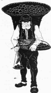
Ὁ γεμιστζῆς (πωλῶν ὀπωρικὰ)

πρὸ αὐτῆς στενὴν περιοχὴν, εἰς τὴν ὁποῖαν μόλις θὰ ἐχωροῦσε νὰ ξεδιπλωθῇ ἀνέτως μία φοῦχτα ἀθηναίων διαδηλωτῶν. Καὶ ὅμως