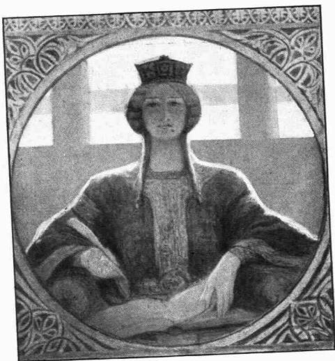
Ἄννα ἡ Κομνηνή.

— Ἐμπρός εἰς τὰ συμφέροντα τοῦ Κράτους, ἢ διαδοχῇ ὑποχωρεῖ. Ἄν εἶναι ἐκεῖνος ἀδελφός μου, σὺ εἶσαι σύζυγός μου.