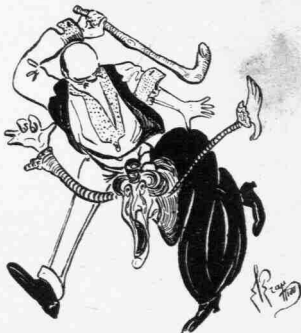
Τὴν βάθει κάτω καί τῆς μετράει παρά μίαν τεσσαράκοντα.