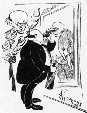
Παρηκολούθει μέ αὐταρέσκειαν τὴν μεταμόρφωσίν του...

Ἄλλὰ καί ὁ ἴδιος δὲν ἀνεγνώριζε τὸν ἑαυτὸν του.