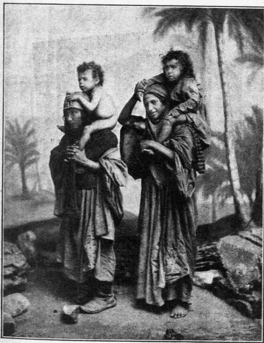
Ἀθιγγανίδες κρατοῦσαι τὰ βρέφη των.

Ὠμιλοῦσαν δυνατά, ἐγελοῦσαν, συνεζήτουν καὶ ἐχειρονόμουν, ἐκύταζαν ποῦ νὰ εὔρουν τὸν τόπον τὸν καλλίτερον γιὰ ν' ἀναπαυθοῦν καὶ πάλιν νὰ ἐξακολουθήσουν τὴν ὁδοιπορίαν. Τὰ κουδούνια τῶν μουλαριῶν ποῦ ἐκρέμοντο μαζὶ μὲ τῆς γαλάζιες