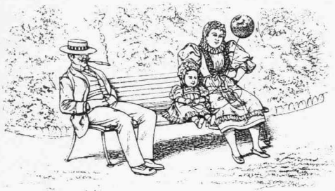
Α.— Ρεμβασμός καὶ μακαριότης