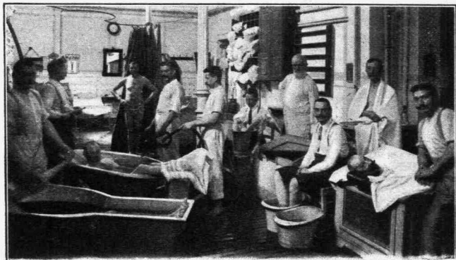
Αἴθουσα ὑδρολουσίας ἀνδρῶν.

Νέα ἀποθάρρυνσις!.. Μικροῦ δεῖν νὰ μιμηθῶ τοὺς ἐκ Λαρίσσης φυγάδας ἐκ τῆς σικιᾶς τοῦ Ἐτέμ, ἕνα μὴ διὰ τετάρτης ἀποπειράς μου φέρω καὶ ἀλλαγῶ τὸν... θάνατον ἄλλων ἱατρῶν. Ἄλλως ἐκ τῶν ἀλλεπαλλήλων ἀποτυχιῶν εἶχε σπουδαίως κλονισθῆ ἡ πεποιθήσις μου. Διὰ νὰ δικαιολογήσω δὲ ὅπως δῆποτε, ἐν τῇ συνειδήσει μου