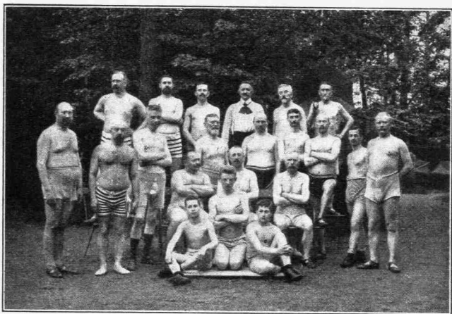
Ἀερολογία ἀνδρῶν μετὰ βροχὴν κατὰ Ἰούλιον.

Ὁ Λάμαν ἐσκέφθη, ὅτι ὁ ἄνθρωπος, γεννηθεὶς γυμνός, ἦτο προωρισμένος νὰ μένῃ γυμνός, διέστρεψε δὲ τὴν φύσιν, δημιουργήσας ἐνδυμασίαν. Τὸ χερίστον ὅτι τὰ φύλλα τῆς συκῆς, ἅπερ πρώτη ἐχρησιμοποίησεν ἡ Εὔρα, κατὰ τὰς παραδόσεις τῆς ἀνθρωπότητος, — κατὰ τοὺς μὲν ἐξ αἰδοῦς, κατ' ἄλλους δ' ἐκ φιλαρσεσκείας — διεμορφώθησαν εἰς ἐνδυμασίαν ἀμφοτέρων τῶν φύλων καὶ δὴ κακίστην. Οἰαδῆποτε ἐνδυμασία, μάλιστα δὲ εἰς τὰς γυναῖκας, καθιστᾷ εὐπαθὲς τὸ σῶμα, διότι εἶναι φορεὺς ἄριστος παντοίων νόσων.