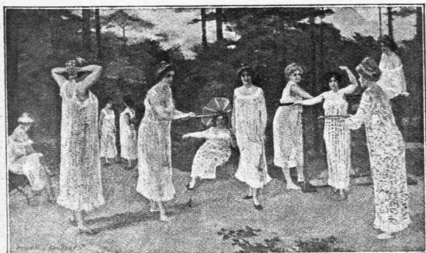
Ἀερολουσία μετὰ γυμναστικῆς κυριῶν.

Ἡ ἐκ νέου ἐμφάνισις τοῦ ἀνθρώπου εἰς ἀδαμιαίαν περιβολὴν ἀντίκειται οὐ μόνον εἰς τὰς ἀξιώσεις τοῦ ψευδοπολιτισμοῦ ἀλλὰ καὶ εἰς τοὺς ποινικοὺς κώδικας ὄλων τῶν κρατῶν. "Ἄλλως δὲ ἡ ἀπότομος μεταβολὴ θὰ ἠϋξάνε τεραστίως τὰς ἐργασίας τῶν νεκροθαπτῶν. Ἄναζητῶν ὁ Λάμαν τὴν θεραπείαν τοῦ κακοῦ, νομίζει ὅτι ἀνευρίσκει αὐτὴν διὰ τοῦ ὑπ' αὐτοῦ ὑποδεικνυομένου συστήματος τῆς μεθοδικῆς ἀερολουσίας πρὸς δύο σκοποὺς: τὸ μὲν ὅπως τῇ βοηθείᾳ τῆς ψυχρολουσίας, τῆς ἡλιολουσίας καὶ ἄλλων τινῶν μέσων ἐπιτύχη