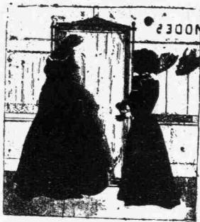
Τὸ πτερὸν τοῦ καπέλλου

των ἀφωσιωμένων ; Συρροή δυσμενῶν περιστάσεων καὶ ἀτμοσφαῖρα παθῶν συνετέλεσαν εἰς τὴν μοιραίαν ἐξέλιξιν τῶν θλιβερῶν ἐκείνων γεγονότων τοῦ Ναυπλίου. Ἡ αὐθίκετος φυλάκισις τοῦ Πετρόμπεη, τοῦ Ἀρχηγέτου καὶ Προστάτου τῆς ἐθνεγερσίας— ὕβρις, ἥτις κατὰ τὰ κρατοῦντα παρὰ τοῖς Μανιάταις ἔθιμα μόνον διὰ θανάτου τιμωρεῖται καὶ ἀποπλύνεται — ἡ ἀπηνῆς κατ' εἰσηγήσεις ἀτυχεῖς καὶ ἐκ παραγνωρίσεως καταδιώξεις τῶν μελῶν τῆς οἰκογενείας αὐτοῦ, ὁ κοχλάζων ἀναβρασμὸς κατὰ τοῦ Κυβερνήτου ὡς πολιτικοῦ ὄργανου ξένης καὶ κραταιᾶς δυνάμεως, ἡ κατὰ τὰς ἡμέρας ἐκείνας παρασκευαζομένη ἐκστρατεία κατὰ τῆς Ὑδρας, πρωτίστως ὅμως τὸ κορυφωθὲν αἶσθημα τῆς προσωπικῆς ἐκδικήσεως καὶ τῆς τιμωρίας — ὑπῆρξαν τὰ ἐλατήρια τοῦ ὀλεθρίου διαβήματος τῶν δύο τούτων τέκνων τῆς Μάνης καὶ οὐχὶ ἡ ἐξυπηρέτησις ξένων παθῶν, διότι ἦτο ἀδύνατον, ἄνδρες μὲ τοιοῦτον ἀνεπίληπτον παρελθὸν καὶ μὲ ἀληθεῖς θυσίας εἰς τὸ εὐγενὲς εἶδωλον τῆς πατρίδος, νὰ γίνωσι τυφλὰ ὄργανα τῆς κατὰ τοῦ Κυβερνήτου ἀντιπολιτεύσεως.