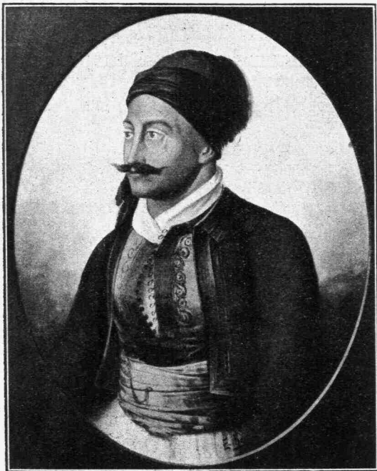
Γεώργιος Π. Μαυρομιχάλης

Οἱ δύο οὗτοι ἄνδρες, οἱ τοιαύτας πρὸς τὴν πατρίδα θυσίας παρασχόντες, ἐπέπρωτο νὰ ὀπλίσωσι τὴν χεῖρα αὐτῶν κατὰ τοῦ ἀνωτάτου τῆς πολιτείας ἄρχοντος, τοῦ ἀειμνήστου Καποδιστρίου. Βεβαίως ἡ ἱστορία θὰ διαλευκάνῃ μίαν ἡμέραν τὰς αἰματηρὰς ταύτας σελίδας τῆς ἱστορίας. Διότι, εἶνε ποτὲ δυνα-