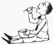
ΣΚΗΝΗ Γ'. — Τὸ ἐντρύφημα τοῦ γλυκοῦ.