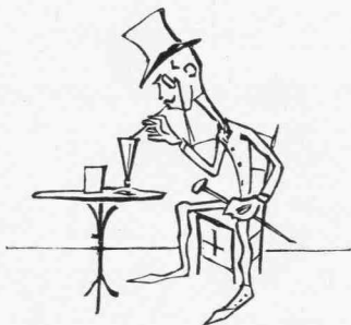
Ὁ υἱός, ἔταν ὁ πατήρ δουλεύη.

λέξιν, ἐν βλέμμα καὶ οὗτοι ἀναλύονται, τηχόμενοι ὑπὸ τὴν ἐπήρ- ρειαν τοῦ βλέμματός της καὶ τοῦ πυρός τοῦ μειδιάματός της.